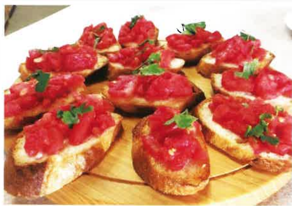
▲ブルスケッタ イタリアの軽食