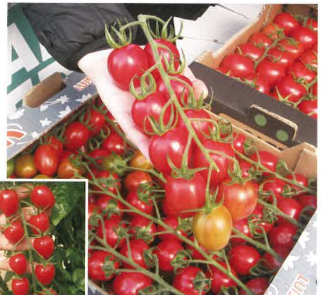
◀サンティプラム ▲サンストリーム

プラム果形の中玉トマト。平均果重40~45g。艶のある真っ赤な果実と長くボリューム感のある房が美しい。各果房に8~10果で、房どりも個採りもできる。食味がよく、しっかりと肉質。環境制御のできる温室で育てると、品質が安定し多収となる。(表紙写真)