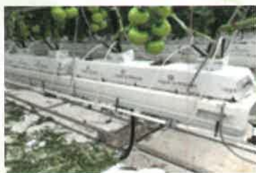
サンプル：提出図面

1000×200×120mmのスラブには、約19.2Lの水分を含むことが可能です。